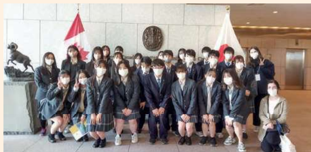
カナダ大使館訪問

30年以上の伝統があり、講演会は毎年、国際的に活躍している方々を講師に迎えて行われます。シンポジウムでは複数の国のパネリストから様々な価値観を学びます。