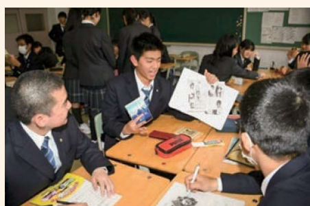
読書プレゼンテーション (1学年)