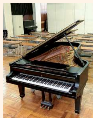
三田の伝統を象徴するスタインウェイ

敷地内には、大名屋敷の築山の名残と言われる「オセンチ山」が佇み、歴代生徒の奮闘を見守ってきました。また校内には、三田の伝統を象徴する「スタインウェイ」が大切に保管され、現在もスタインウェイ・コンサート等の行事で出番があります。