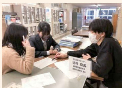
自主学習を支援するサポーター