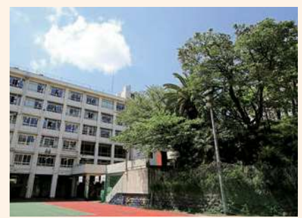
歴代生徒の奮闘を見守ってきたオセンチ山