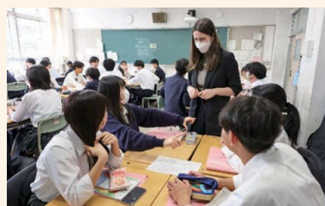
英語コミュニケーションⅡ