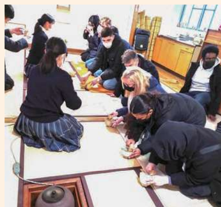
令和4年度 スウェーデンクララ高校との交流

令和5年1月にはスウェーデンのクララ高校より、実に3年ぶりとなる海外校の訪問を受けました。授業参加や部活動見学を通じて本校生徒たちと活発な交流が行われ、英語で直接コミュニケーションをとる貴重な機会となりました。